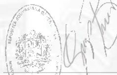
GREICYS DAYAMNI BARRIOS PRADA MINISTRA DEL PODER POPULAR DE AGRICULTURA URBANA Designada mediante Decreto N° 4.280 de fecha 03 de septiembre de 2020, publicado en la Gaceta Oficial de la República Bolivariana de Venezuela N° 41.957 de la misma fecha

Comuníquese y Publíquese. Por el Ejecutivo Nacional,