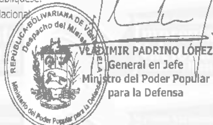
VLADIMIR PADRINO LÓPEZ General en Jefe Ministro del Poder Popular para la Defensa

Comuníquese y publíquese. Por el Ejecutivo Nacional,