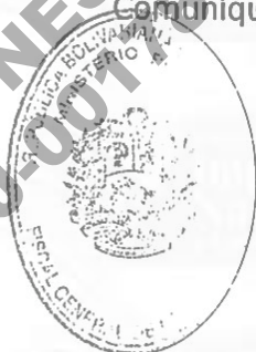
TAREK WILLIANS SAAB Fiscal General de la República