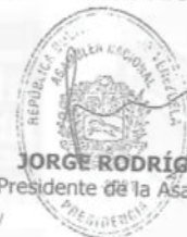
JORGE RODRÍGUEZ GOMÉZ Presidente de la Asamblea Nacional

Dado firmado y sellado en el Palacio Federal Legislativo, sede de la Asamblea Nacional, en Caracas, a los diecinueve días del mes de mayo de dos mil veintidós. Años 212° de la Independencia, 163° de la Federación y 23° de la Revolución Bolivariana.