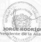
JORGE RODRÍGUEZ GOMÉZ Presidente de la Asamblea Nacional

Dado firmado y sellado en el Palacio Federal Legislativo, sede de la Asamblea Nacional, en Caracas, a los dieciséis días del mes de junio de dos mil veintidós. Años 212° de la Independencia, 163° de la Federación y 23° de la Revolución Bolivariana.