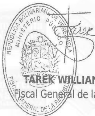
TAREK WILLIANS SAAB Fiscal General de la República