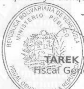
TAREK WILLIAMS SAAB Fiscal General de la República