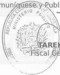
TAREK WILLIANS SAAB Fiscal General de la República