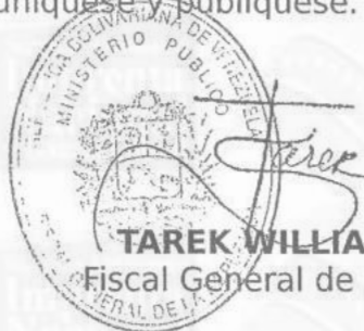
TAREK WILLIANS SAAB Fiscal General de la República